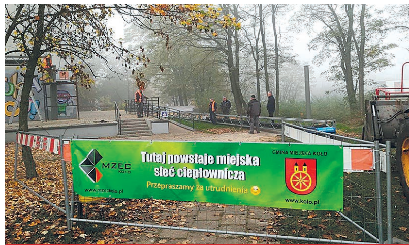
Trwa stała rozbudowa sieci ciepłowniczej. MZEC sukcesywnie rozbudowuje sieć ciepłowniczą, co jest częścią strategii rozwoju spółki, a służyć ma poprawie stanu środowiska