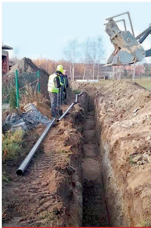
Trwa stała rozbudowa sieci kanalizacyjnej. Osiedle „kamieni szlachejnych” jeszcze w tym roku będzie miało nowe przyłącze wodociągowe