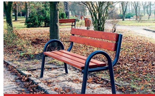
Montaż ławek i koszy w Parku 600-lecia. Koszt zadania 57.000 zł