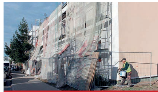
Remont kamienicy przy ul. Sienkiewicza 25. Koszt inwestycji 160.112,01 zł