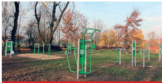
Siłownia plenerowa w Parku 600-lecia. Koszt inwestycji 50 tys. zł, kwota dofinansowania ze środków Funduszu Rozwoju Kultury Fizycznej 25 tys. zł