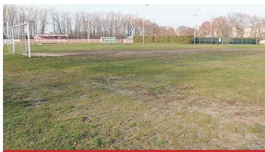
Boisko zostanie pokryte trawą syntetyczną