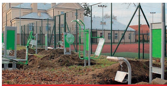
Siłownia plenerowa przy SP nr 3. Koszt inwestycji 50 tys. zł