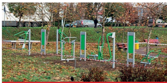
Siłownia plenerowa na ul. Włocławskiej. Koszt inwestycji 50 tys. zł, kwota dofinansowania ze środków Funduszu Rozwoju Kultury Fizycznej 25 tys. zł