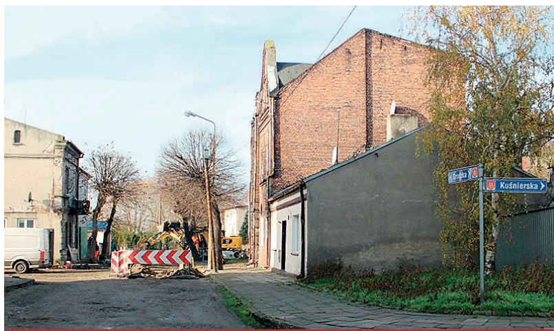
Budowa ul. Grodzkiej. Całkowita wartość inwestycji wynosi 918.118 zł, w tym dofinansowanie z rządowego programu Fundusz Dróg Samorządowych w kwocie 459.059 zł