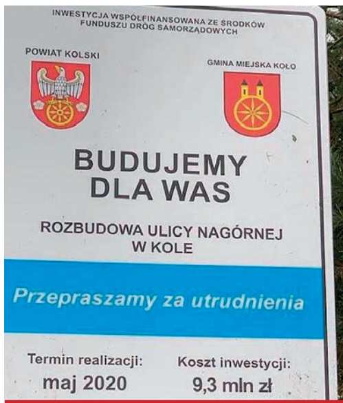
Rozbudowa ul. Nagórnej. Wkład miasta w zadanie – 2.564.000 zł