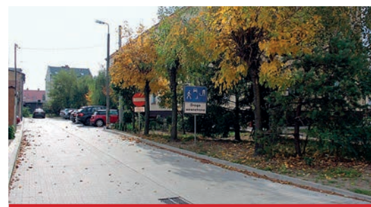
Nowa droga wewnętrzna przy bloku Toruńska 66. Koszt inwestycji przekroczył 100 tys. zł