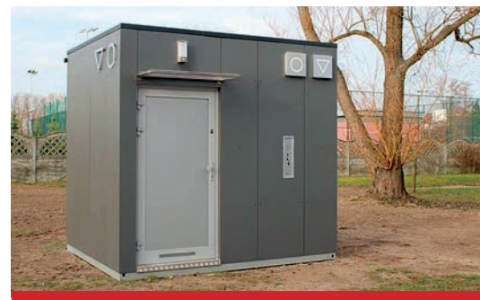
Toaleta publiczna przy ul. Sportowej. Koszt zadania 115.620 zł