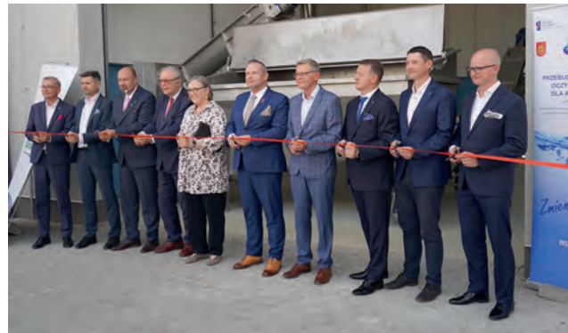
Przebudowa i Modernizacja Oczyszczalni Ścieków dla Aglomeracji Koło