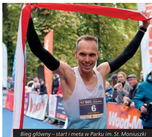
Bieg główny – start i meta w Parku im. St. Moniuszki

„Lider rozwoju futbolu”. – Dla mnie i dla naszego miasta to wielki zaszczyt, gdyż znaleźliśmy się w niewielkim gronie pięciu wyróżnionych w całej Wielkopolsce – powiedział burmistrz, dodając: Doceniono nas m. in. za inwestycje w infrastrukturę sportową.