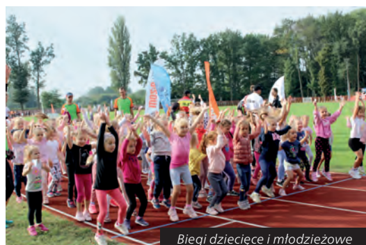
Bieg dziecięce i młodzieżowe

Celem wydarzenia było upowszechnienie triathlonu wśród młodzieży i dorosłych jako wszechstronnej formy ruchu oraz promowanie regionalnych szlaków i miejscowości turystycznych wzdłuż rzeki Warty. Ze względu na rozmach organizacyjny i szerokie uczestnictwo, impreza rozslawia nasze miasto w Polsce.