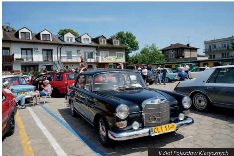
II Zlot Pojazdów Klasycznych