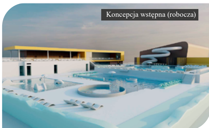
Koncepcja wstępna (robocza)

Przypomnijmy, że koszt opracowania dokumentacji projektowej wraz z nadzorem autorskim to 921.270,00 zł, a zakończenie planowane jest na listopad 2026 roku. Inwestycja nosi nazwę: "Rozbudowa obiektu sportowego – Pływalni Miejskiej – o budowę zewnętrznego obiektu z wykorzystaniem wód termalnych – dokumentacja projektowa". Projekt zakłada stworzenie nowoczesnego kąpieliska zewnętrznego, które będzie korzystać z unikalnych zasobów naturalnych Koła – wód geotermalnych z odwiertu Koło GT-2.